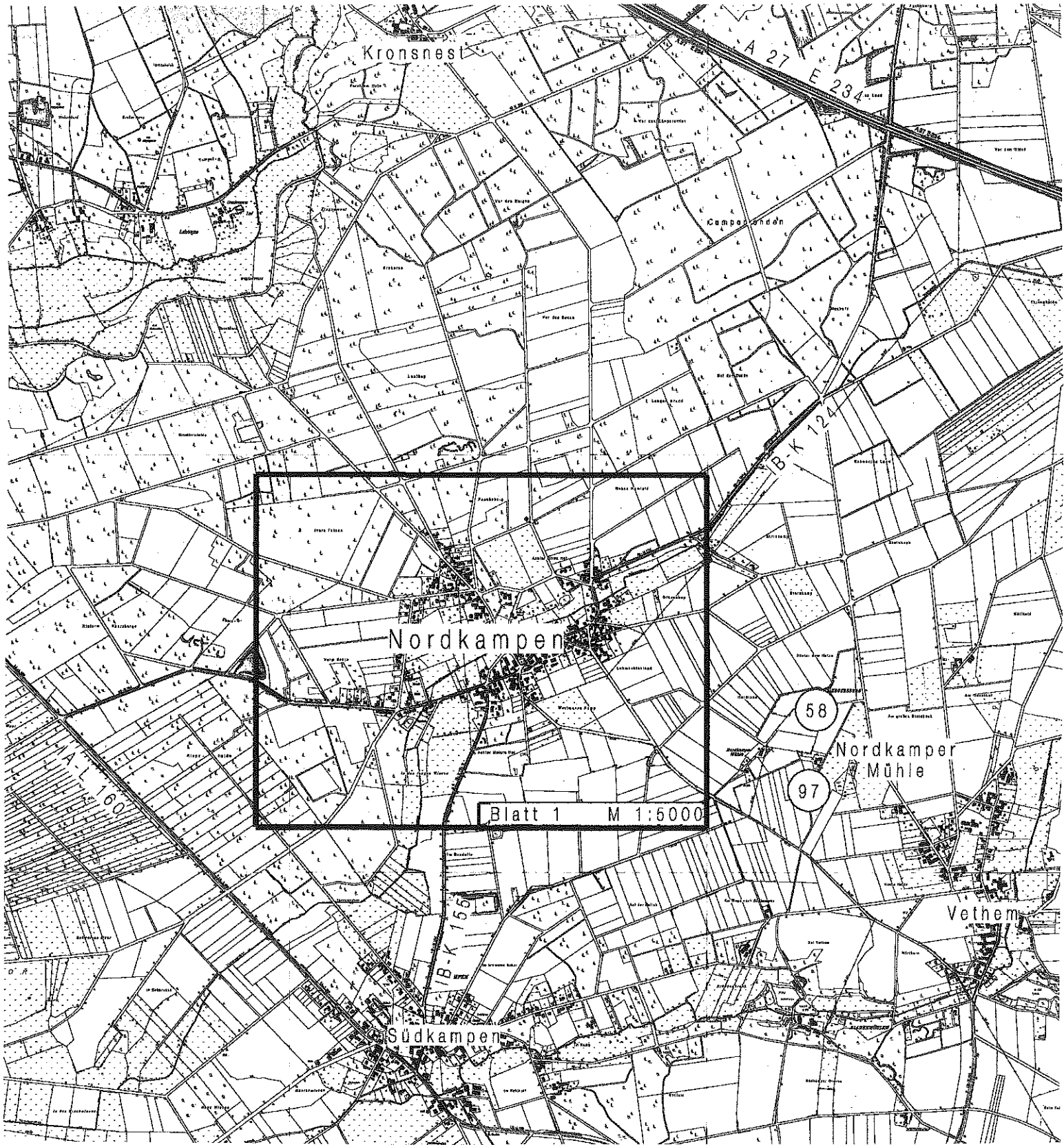
Übersichtsplan M 1 : 25000