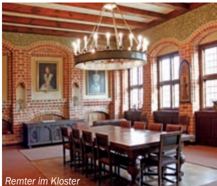
Remter im Kloster